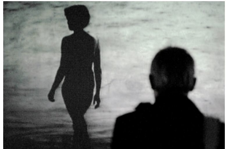
Кенридж любит контрасты, противопоставление черного и белого.

Меньше всего хочется писать о Кенридже рецензию – там вы увидите то-то, а в этом углу удачно поставили это. Для самого Кенриджа любая расстановка-компоновка, что в работе, что в зале, – лишь способ выразить то, что между строк. Выразить, не сказать словами. Послание Кенриджа экспрессивно – про права гражданские и человеческие. Но оно лишено пафоса горячительной полемике в духе «Доколе ж!...». А потому и глуже.