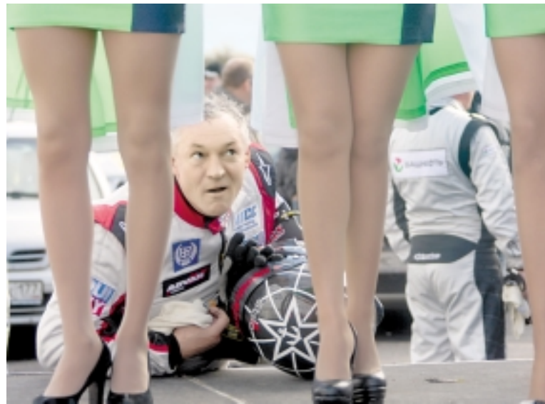
Гонки всегда должны быть зрелищными.