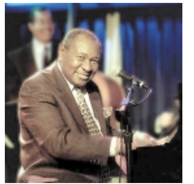
Легенда американского джаза Фредди Коул.

КОНЦЕРТ В столице выступит живая легенда американского джаза Фредди Коул. Американский певец и пианист даст единственный юбилейный концерт 13 октября в московском международном Доме музыки. В свои 80 он остается «последним из могикан» старой школы. Уже нет в живых Фрэнк Синатры, Билли Экстайна, Нэта «Кинга» Коула. Нельзя сказать, что старший брат и его дочка Натали Коул затмевали Фредди. Они просто были чуть известнее. Но время все расставило на свои места. И любители джаза оценили богатый тембр его голоса, искренность интонаций, лиричность подачи и приятную хрипотцу Фредди Коула. С пяти лет он играл на пианино, отличал соул от блюза и встречался с Дюком Элингтоном и Каунтом Бэйси, которые запросто заходили в гости в его пропитанный музыкой дом в Чикаго. Страшно подумать, но его дебютный альбом The Joke's on Me вышел в 1952-м и был назван прессой «самым метким выстрелом