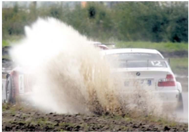
В сложных погодных условиях зритель не всегда может понять, что происходит на трассе.

Полностью текст интервью читайте на интернет-сайте antrakt.ng.ru