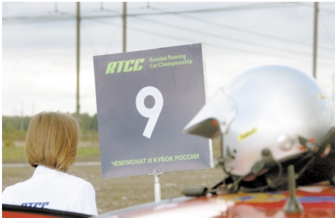
Красивого шоу без гонщиков быть не может.

– Произошел очень серьезный сдвиг, но в каких-то вещах хотелось бы добиться большего. У нас стали появляться трассы. Неожиданно автодромы стали строить чуть ли не во всех регионах. А сколько проектов приходит в Федерацию автоспорта с просьбой «Мы тоже хотим!», сколько областных центров, столько там потенциальных трас! Это хорошо, конечно, и позволяет с оптимизмом смотреть в будущее. Понимаете, очень сложно привлечь на соревнования даже тех, кто на самом деле любит гонки и автомобили, если они не будут знать, что происходит внутри чемпионата, серии. Иванов, Петров гоняются. Зачем гоняются? Почему гоняются? Почему кто-то остановился, кто-то поехал? В какой-то момент можно привлечь картинкой, скажем, аварийной, но потом интерес падает. Уходящий сезон знаменателен еще и потому, что идет персонификация гонок. Становятся известны имена, гонщики превращаются в медийные фигуры.