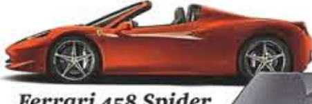
Ferrari 458 Spider