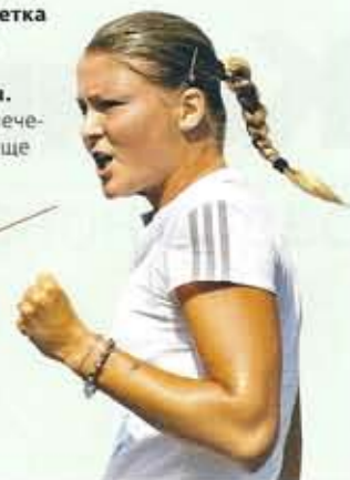
Динара Сафина, теннисистка, серебряный призер Олимпийских игр

Последние полгода бывшая первая ракетка мира не выступала на соревнованиях из-за травмы спины. Но она продолжает лечение и надеется, что еще сможет вернуться в большой спорт.