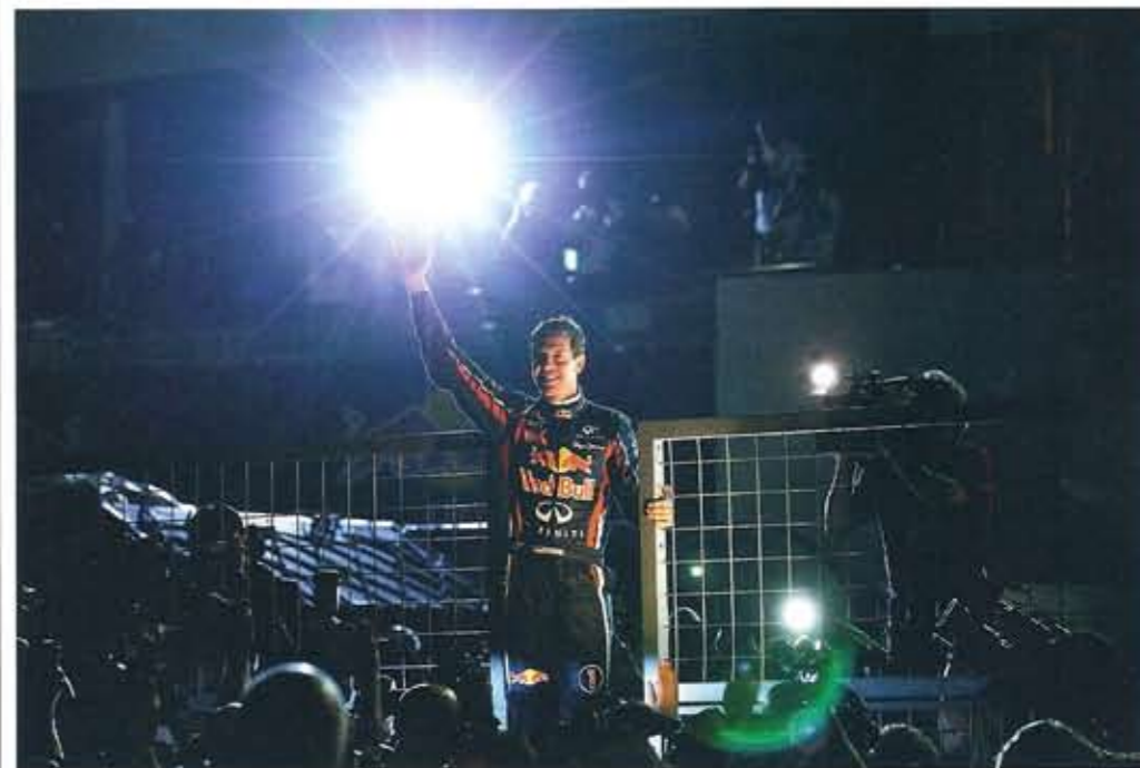
СЕБАСТЬЯН ФЕТТЕЛЬ досрочно стал чемпионом «Формулы-1» после Гран-при Японии. К финишу 15-го этапа немецкий гонщик из команды «Ред Булл» пришел на третьей позиции, что сделало его недосягаемым для соперников в общем зачете. 24-летний Феттель выиграл чемпионат второй раз подряд и стал самым молодым двукратным победителем «Формулы-1».